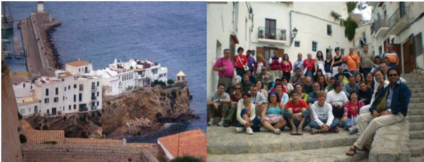
Los usuarios de las asociaciones vascas disfrutaron de unos espléndidos días de vacaciones que aprovecharon para hacer turismo y reforzar sus vínculos de amistad

“Muy buenas, pasajeros... Les habla el comandante del vuelo Barcelona-Ibiza. Perdonen la molestia de la espera, pero hemos tenido que reparar las válvulas del avión... (ya está metiéndonos miedo), espero que tengan un buen viaje”