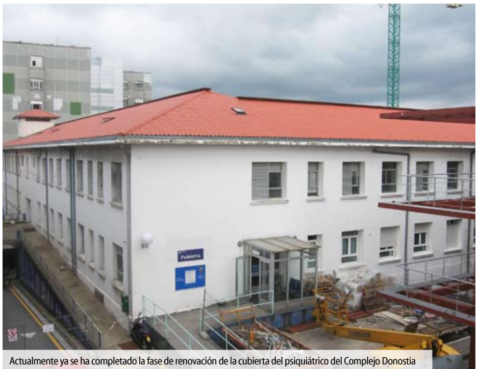
Actualmente ya se ha completado la fase de renovación de la cubierta del psiquiátrico del Complejo Donostia

El futuro psiquiátrico, con sus nuevas y optimizadas instalaciones, supondrá una gran mejora en materia asistencial. Estará provisto de dos unidades de enfermería y de 21 habitaciones, ocho individuales y trece dobles, que acogerán hasta 68 pacientes adultos. También dispondrá de ocho camas en la Unidad Infanto-Juvenil, varios despachos médicos, sala de estar para familiares, comedor y sala de estar para pacientes, un jardín para los usuarios adultos y otro infanto-juvenil con acceso directo a planta y frontón, entre otras muchas prestaciones.